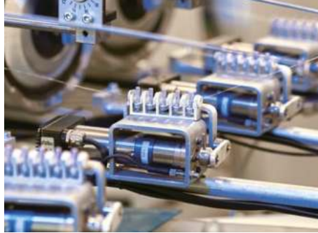
geregelter Schusseintrag ETM/ETC