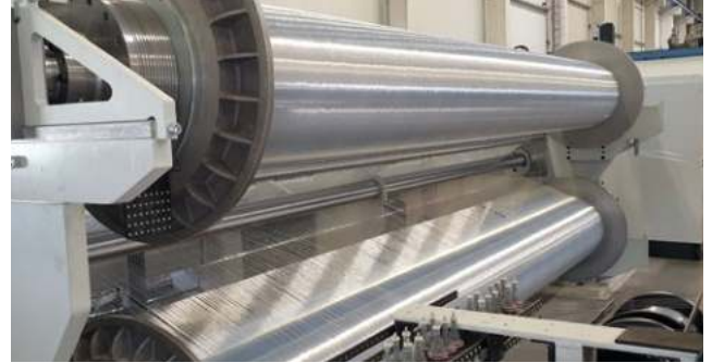
Kettbäume sektional geschärt