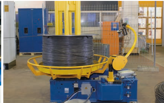
Dérouleur motorisé avec bras de compensation