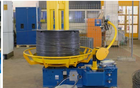
Portabobinas con brazo compensador