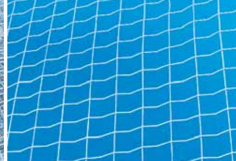
Ограждения из тонкой проволоки