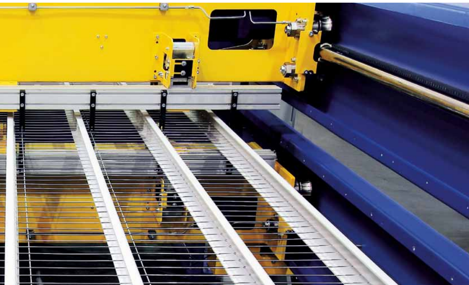
2-х гребенчатый выпуск решеток