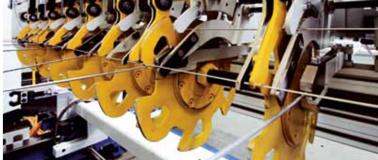
Дисковый ввод поперечной проволоки