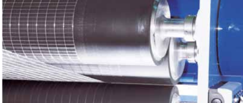
Подача сетки обрезаемыми вальцами