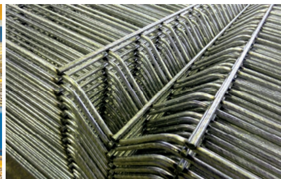
Сетка трехмерного ограждения