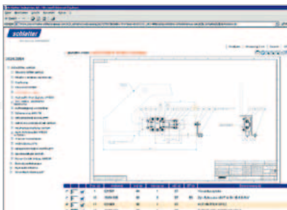
Catalogue de pièces détachées

En tant que client, vous pouvez rechercher sur notre plateforme «MySchlatter.com» des pièces de rechange en ligne, les identifier et les déposer simplement dans votre panier. Grâce au catalogue intégré de pièces détachées, vous pouvez sélectionner ce dont vous avez besoin simplement, à tout moment et de partout dans le monde entier.