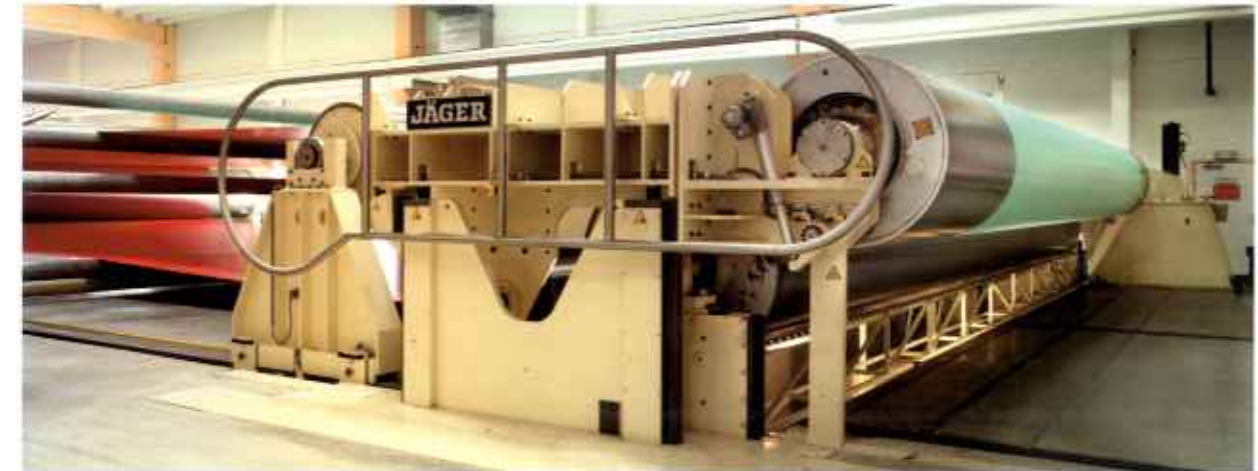
Ausrüstungsmaschine mit zwei ölbeheizten Walzen