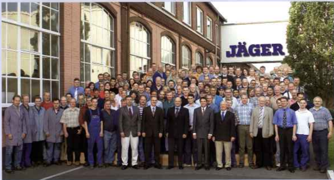
Das Jäger Team

Jäger blickt auf eine mehr als 130-jährige Unternehmensgeschichte zurück. Heute stellt ein kompetentes Team von 200 Mitarbeitern Maschinen zur Herstellung von Papiermaschinenbespannungen, Drahtwebmaschinen und Armierungsgitterschweißmaschinen her. Durch das Know-how der Mitarbeiter und der Innovationsfähigkeit des Unternehmens sind wir für unsere Kunden der langfristig zuverlässige Partner.